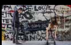
CABOSANROQUE Martes 2 agosto | 21:45 h Fundación Luis Seoane