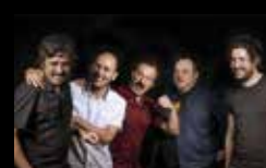
TACHENKO Martes 2 de agosto | 22:00 h Praza de San Nicolás