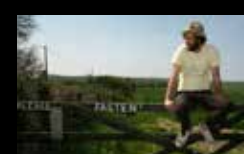
NEIL HALSTEAD Xoves 4 de agosto | 22:00 h Castelo de Santo Antón