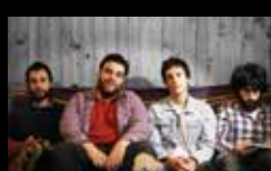
KOMÓDO Sábado 6 de agosto | 21:30 h Praia de Riazor