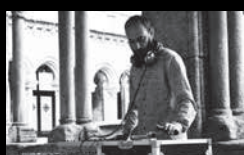
GREUS Xoves 4 de agosto | 23:30 h Campo da Leña