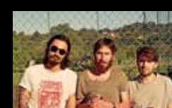
ULTRASURF Martes 2 de agosto | 22:30 h Campo da Leña