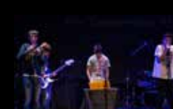
SENECTUD SIDERAL Xoves 4 de agosto | 19:00 h Praza das Bárbaras