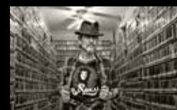
HOWE GELB Mércores 3 de agosto | 22:00 h Castelo de Santo Antón