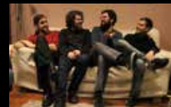
DIARIODEVERANO Martes 2 agosto | 19:00 h Praza das Bárbaras