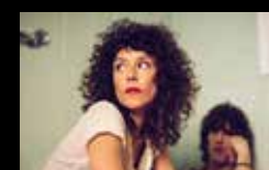
NIÑA COYOTE ETA CHICO TORNADO Xoves 4 de agosto | 22:30 h Campo da Leña