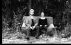
PRESUMIDO Mércores 3 de agosto | 20:00 h Praza das Bárbaras