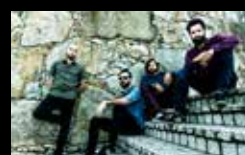
LADY LEÑO Xoves 4 de agosto | 20:00 h Praza das Bárbaras