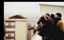
OS AMIGOS DOS MÚSICOS Domingo 7 agosto | 12:30 h Parque do Paseo das Pontes