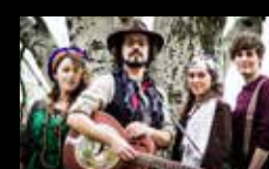
O CADELO LUNÁTICO Venres 5 de agosto | 22:30 h Praia de Riazor