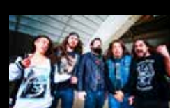
STRIKEBACK Mércores 3 de agosto | 22:30 h Campo da Leña