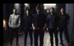
LOS ÁRBOLES Mércores 3 de agosto | 22:00 h Praza de San Nicolás