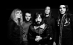
SEX MUSEUM Mércores 3 de agosto | 23:15 h Praza de San Nicolás