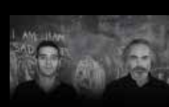
COMANDO PSICOGRÁFICO Xoves 4 de agosto | 21:45 h Fundación Luis Seoane