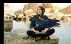
ARIES Domingo 7 de agosto | 17:45 h Parque do Paseo das Pontes