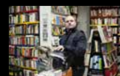
NIÑO DE ELCHE Mércores 3 de agosto | 22:15 h Praza das Bárbaras