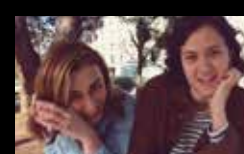
REMEMBERS Martes 2 de agosto | 20:15 h Praza de San Nicolás