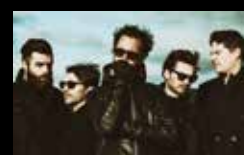
EDITORS Sábado 6 de agosto | 01:00 h Praia de Riazor