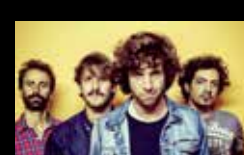
PROYECTO KOURNIKOVA Martes 2 de agosto | 21:00 h Praza de San Nicolás