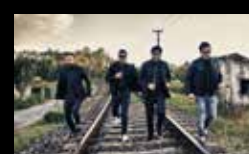
FRIPP & KITTE Xoves 4 de agosto | 20:15 h Praza de San Nicolás