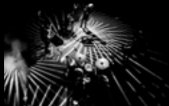
BELGRADO Martes 2 de agosto | 23:30 h Campo da Leña