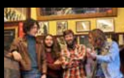
MELANGE Xoves 4 de agosto | 22:15 h Praza das Bárbaras