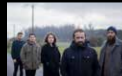
CHICHARRÓN Mércores 3 de agosto | 21:00 h Praza das Bárbaras