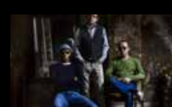
OCEAN COLOUR SCENE Venres 5 de agosto | 01:00 h Praia de Riazor