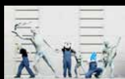
LOOK OUT BROTHER! Sábado 6 de agosto | 22:30 h Praia de Riazor