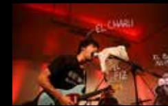
VOZZYOW Martes 2 de agosto | 21:45 h Campo da Leña

30 EDICIÓN FESTIVAL NOROESTE ESTRELLA GALICIA 2,7 AGOSTO 2016 - A CORUÑA