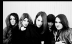
AGORAPHOBIA Mércores 3 de agosto | 21:00 h Praza de San Nicolás