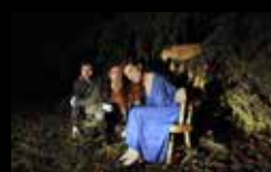
JAS PROCESSOR Domingo 7 de agosto 12:00 a 20:30 horas Parque do Paseo das Pontes