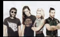
THE CAPACES Mércores 3 de agosto | 23:30 h Campo da Leña