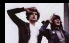
SRASRSRA Mércores 3 de agosto | 21:45 h Campo da Leña