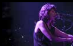
MAUD THE MOTH Xoves 4 de agosto | 21:00 h Campo da Leña