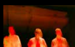
BALAGO Mércores 3 de agosto | 21:45 h Fundación Luis Seoane