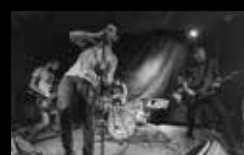
CUCHILLO DE FUEGO Xoves 4 de agosto | 21:45 h Campo da Leña