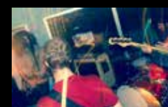
MANO DE OBRA Mércores 3 de agosto | 20:15 h Praza de San Nicolás