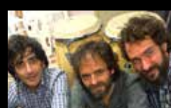
LOS PLUTONES Domingo 7 de agosto | 15:15 h Parque do Paseo das Pontes