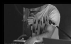
OCRE Mércores 3 de agosto | 19:00 h Praza das Bárbaras