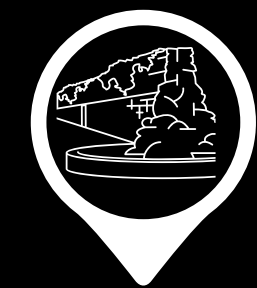
PARQUE DO PASEO DAS PONTES