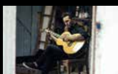
PARDO Martes 2 agosto | 23:15 h Praza de San Nicolás