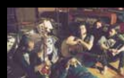
MOURA Xoves 4 de agosto | 21:00 h Praza das Bárbaras