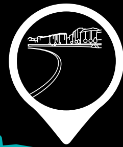
PRAIA DE RIAZOR