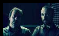
DEIBES Mércores 3 de agosto | 21:00 h Casa Museo Casares Quiroga