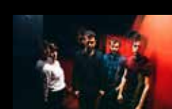
TRIÁNGULO DE AMOR BIZARRO Venres 5 de agosto | 23:30 h Praia de Riazor